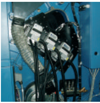
UV-Endtrockner: Eingebaut ist fast nichts mehr zu sehen: UV-Wechselkassetten im Bogenaufgang einer KBA 205.