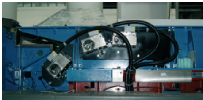
IR-Heißluft-Trockner nach dem 2. Lackwerk einer KBA-205. Energieeffiziente Heißluftterzeugung im Trocknungselement selbst: Hinter dem Luftanschlussrohr (hier noch offen) ist eine integrierte Heizpatrone (4KW System Grafix) erkennbar.