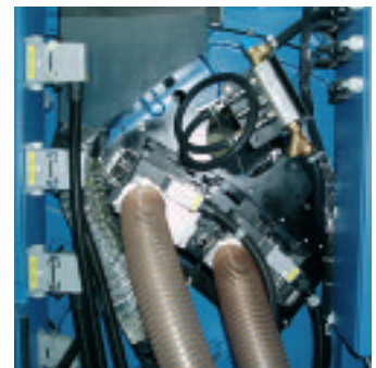
Gleicher Einbauort, anderes Trocknungssystem: Für konventionelle Trocknung sind im Bogenaufgang nun zwei IR-Heißlufttrockner eingebaut

Kühlung, die zumeist kombiniert durch Luft und Wasser erfolgt. So sollte deshalb auch auf die Effizienz der eingesetzten Kühlsysteme geachtet werden, die meist neben der Druckmaschine und etwas im Verborgenen stehen.